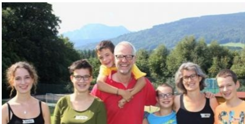
Im Radio-Interview: Unsere

kinderreiche Mitgliedsfamilie Fürst.